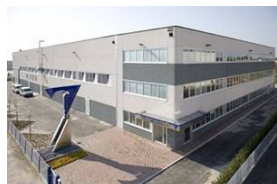
Noventa di Piave (Venezia)